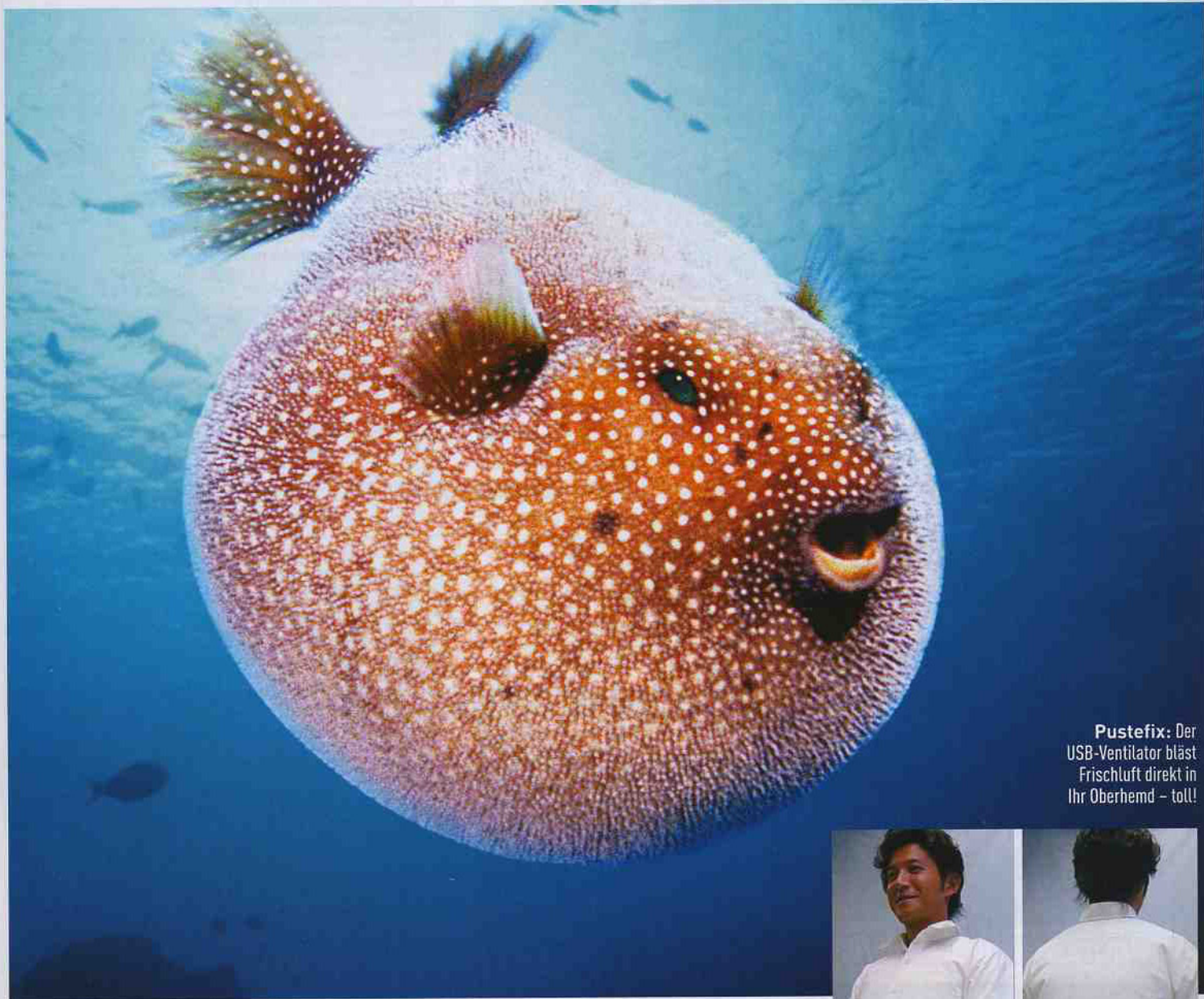
Pustefix: Der USB-Ventilator bläst Frischluft direkt in Ihr Oberhemd – toll!

Ein Oberhemd mit eingebauten Ventilatoren soll vor Schweißausbrüchen schützen.